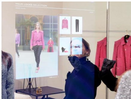
OUTILS & DISPLAY

Échanges avec les équipes en magasin Accompagnement par un expert Retail