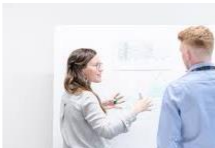
RETAIL AI & DATA